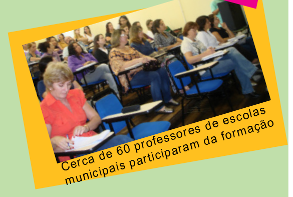
Cerca de 60 professores de escolas municipais participaram da formação