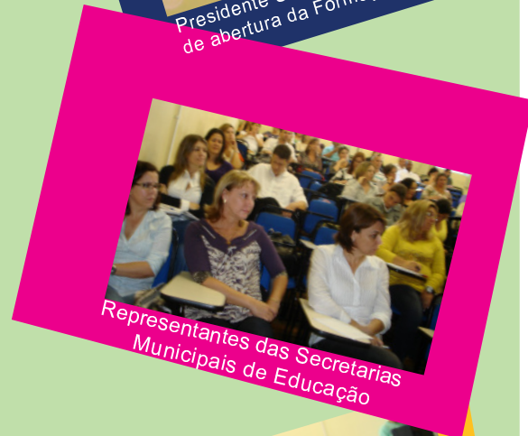
Representantes das Secretarias Municipais de Educação