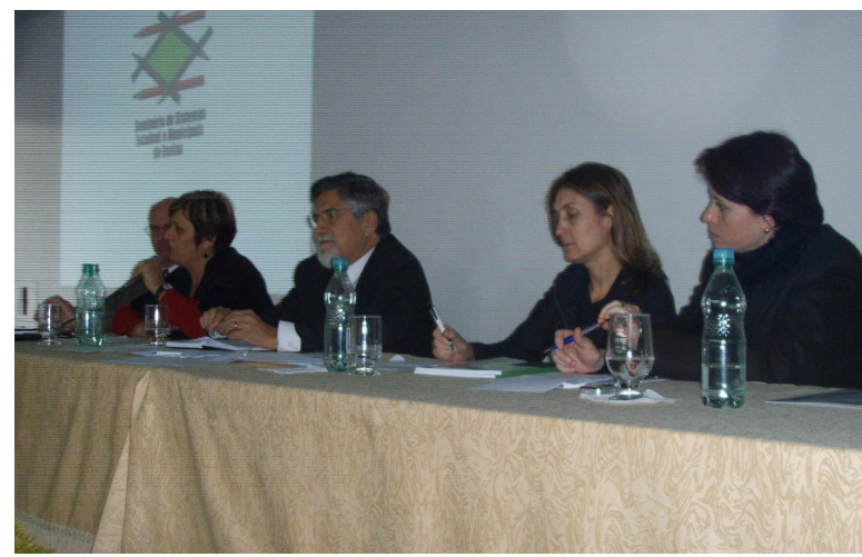
Presidente da Undime/SC ao lado de representantes da Unome e SED

Segundo o Conselho Estadual de Educação de Santa Catarina, que promove o evento, o objetivo destas reuniões é fortalecer a integração entre os Sistemas Estadual e Municipal de Ensino, com vistas ao estabelecimento de políticas e mecanismos voltados ao desenvolvimento de ações que congreguem