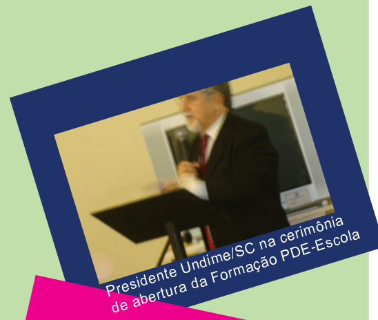
Presidente Undime/SC na cerimônia de abertura da Formação PDE-Escola

É importante lembrar que neste primeiro momento a formação será realizada apenas com escolas prioritárias, ou seja, com o IDEB abaixo da média nacional, designadas pelo Ministério da Educação.