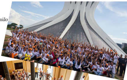
Finalistas Artigo de Opinião