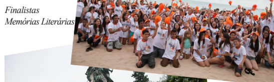
Finalistas Memórias Literárias