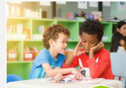
Qualidade da Educação