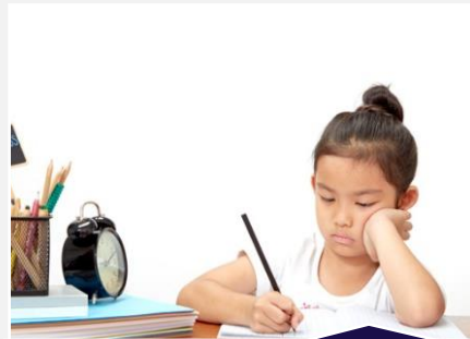
Déficit de Aprendizagem